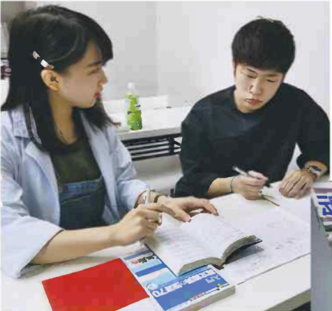
講師が受験生の学習状況を管理する（東京都文京区）