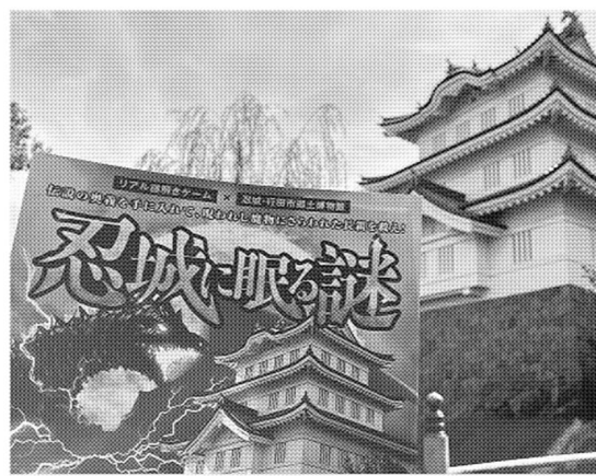
埼玉県行田市では「忍城」周辺をまわる謎解きが楽しめる

「初めて（埼玉県の）リアル謎解きゲーム行田市を訪れ、名産の『行田フライ』なども楽しめた」（20代）、市内を観光し、買い物や食事も堪能できた」（50代） 一般社団法人の行田おもてなし観光局（同市）