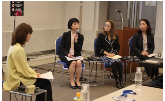
DE&Iワーキンググループは展示会「セミコンジャパン」で女性活躍に関するセミナーを開催（25年12月）

ギャップを埋めるべく、各社は女性人材の獲得に向けた環境づくりを急ぐ。東京エレクトロニクスは24年度に国内の女性社員比率が15%だった。女性を積極登用すべく女性社員を対象としたキャリア研修やリーダー育