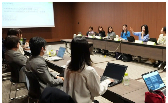
半導体関連企業の女性社員らが定期的に勉強会を開催している（2月、東京都千代田区）