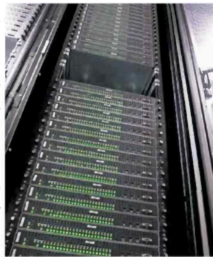
拡張性の高い「リモートPCアレイ」の引き合いが強まっている。

消すにはサーバーや制御プログラム自体を更新する必要があり、膨大な費用がかかる。これに対してPCアレイはシステムの設計がシンプルで、利用が増えれば、カートリッジを追加して機能を向上させることができ、拡張性が高い。ソフトやハードの管理で専門エンジニアも不要で導入にかかる時間も短い。コ