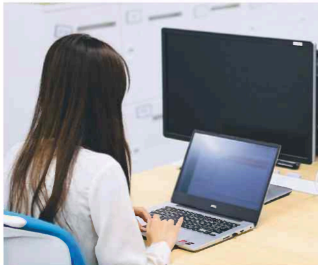
「仮想化」すればデータを端末に残さずに済み、情報漏洩などを防げる（アセンテックのオフィス）

ストも安い。クラウド型のレンタルサーバーが利用される1人当たりの1カ月の利用料金は5千〜6千円程度なのに対し、PCアレイは保守などのコストも含めて1人10万円の初期費用しかかからない。1年半以上使えば割安になる計算だ。