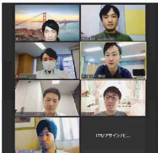
エル・ティー・エスは3月からほぼ全ての社内ミーティングをオンライン化した

エル・ティー・エスは領収書の入力や出退勤管理など、事務作業を自動化するシステムの導入支援を手掛ける。システムの受託開発だけでなく、組織の業務改善のコンサルティンクも請け負う。 例えば、顧客データや販売システムなどが、担当部署ごとにバラバラになっている企業は少なくない。エル・ティー・エスは顧客企業の業務全体を見渡した上で、改善のためにどんなシステムが必要か提案する。昨年、IT（情報技術）企業の買収でエンジニアを増やし、システム開発を外注から内製に移行させた。 2020年12月期の連結営業利益は前期比30%増の4億円を見込む。デジタルトランスフォーメーション（DX）の追い風を受けて受注が増加。株価は今年6月に上場来高値を更新した。