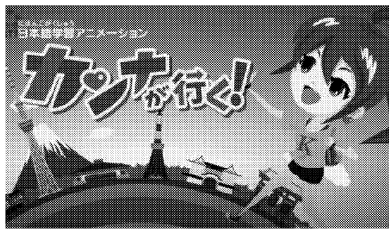
アニメーションで日本語を体系的に学べる

併せて日本語教師が月1回オンラインで面談し、学習のアドバイスや進捗状況の確認なども行う。世界的な新型コロナウイルスの感染拡大で人の往来が難しいこともあり、オンラインでの需要が伸びるとみている。日本語のオンライン学習サイトは他にもあるが、テクノスマイルは日本人教師によるオンライン面談やオンライン試験といった細かい対応をアピ