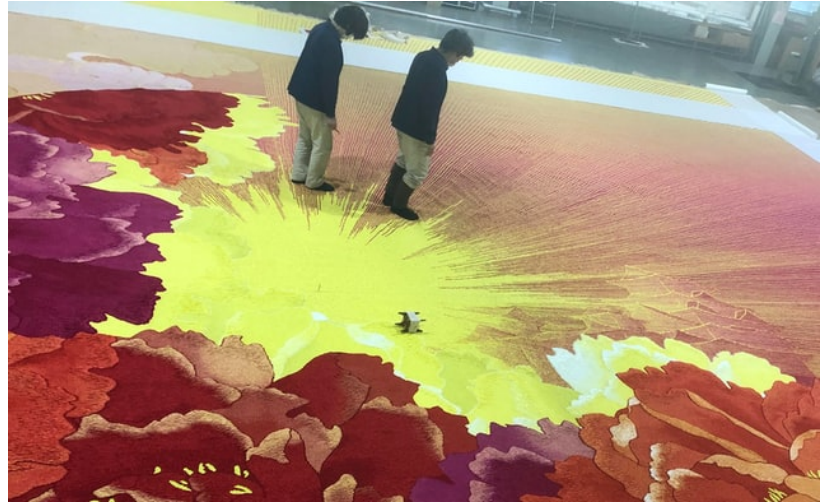
斜めに走る太陽光やシャクヤクの花びらが印象的な中ホール用の緞帳

緞帳は高田氏の故郷、兵庫県姫路市の文化施設「アクリエひめじ」で7月にお披露目される。高田氏はファッションブランド「KENZO」の創設者。世界を舞台に活躍する一方、故郷への思いも強かったという。姫路市や地元企業の依頼を受けて、18年に緞帳の原画2枚をデザインした。シャクヤクは洋服にも多く使い、海外でも日本でも夕日をよく眺めていたという。これに姫路城を加えたデザインにした。