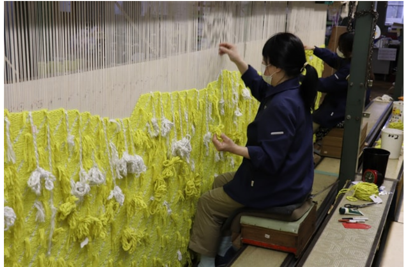
作業者が横並びになって少しずつ織り上げていく

ルを訪問する予定だったが、10月にパリ郊外の病院で亡くなり、叶わなかった。丹後テクスタイルは「総力を尽くした。高田氏にも満足いただける出来になったと思う」としている。