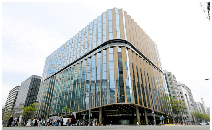
「西日本シティビル」のオフィス賃料は1坪3万6000円と福岡市内で最高水準だ（福岡市）