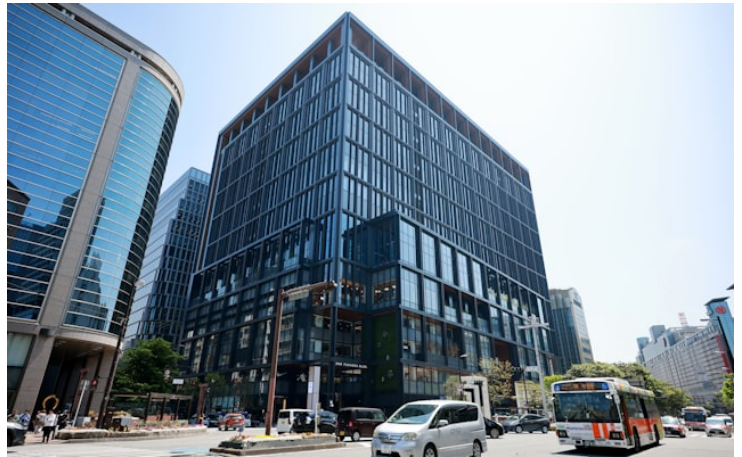
開業1年を迎える「ワンビル」（福岡市）

仮眠室やフィットネスジムなど社員が気軽に気分転換できる空間も備える。西鉄の担当者は「新興企業の先進的なシステムや充実した共用エリアは、質の高い職場環境で人材確保を狙う企業に刺さっている」と話す。