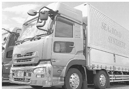
左側面の歩行者や二輪車を検知するAIカメラを搭載したトラック