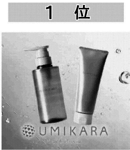
独自の方法で抽出したコラーゲンを配合した

閲覧数トップだった「ブリーチ由来のシャンプー」は、リピーターのファンも多い。世界的な養殖研究をリードする近畿大学水産研究所による養殖アリの研究成果が製品開発に生かされた。 2位の「着圧ハイソックス」は、学生が徹底してユーザーである女子高生の目線に立って商品開発や販売戦略作りをした点が大きな特徴だ。開発メンバーだった学生からは「普段の買い物で店の商品棚や卸業者にも目を配るようになって」との声も聞かれた。 4位のカレー「ぶどう山椒(さんしょう)の陽」や