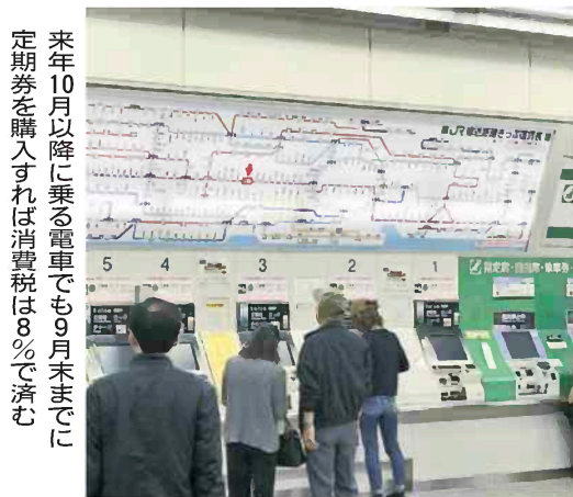
来年10月以降に乘る電車でも9月末までに定期券を購入すれば消費税は8%で済む

来年10月に結婚式を挙げて披露宴を開く場合、消費税の税率は何%か。正解は通常は10%だが、契約時期によっては8%で済む。なぜこうなるのか。 消費税は商品を購入したりサービスを利用したりすると課税され、消費者が負担する。原則、代金と引き換えに商品を受け取る時や、代金を支払ってサービスの提供が完了したときの税率が適用される。つまり、来年10月以降に商品を買ったりサービスを受けたりすれば10%。9月までに申し込んでも、受け取りが10月なら原則10%になる。