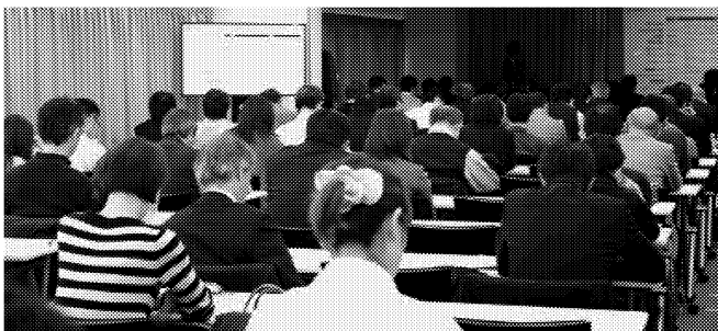
資格の取得をめざす女性の比率が高まっている（個人情報保護士会のセミナー）