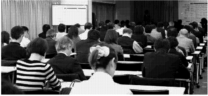
資格の取得をめざす女性の比率が高まっている(個人情報保護士のセミナー)